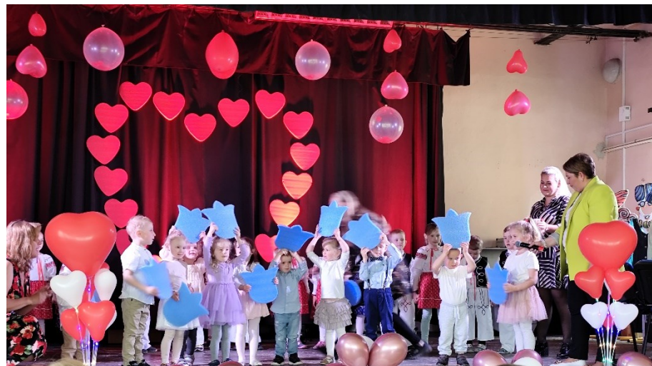
Z vystúpenia žiakov MŠ venovaného Dňu matiek.

V našej MŠ sme pokračovali aj v pohybových krúžkoch a to „Tanečný krúžok“ a „Plavecký výcvik“. Tanečný krúžok bol vedený odborníčkou na hudobno – pohybovú prípravu detí z tanečnej skupiny Fearless, uskutočnený jedenkrát týždenne v priestoroch MŠ. V mesiaci október sa nám podarilo nastúpiť na intenzívny kurz plávania v Aquacity Poprad. Prihlásilo sa nám 6 detí. Cesta bola zabezpečená autobusovou dopravou. Kurz plávania trval 4 mesiace. Výsledky boli pozitívne. Na konci kurzu prekonali deti strach z vody a tak predplavecká príprava splnila svoj účel.