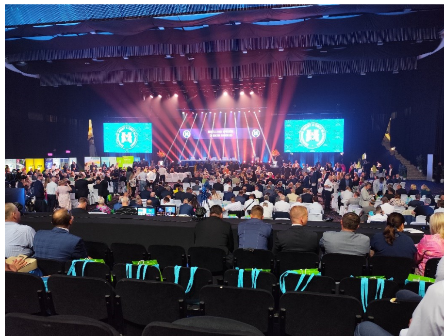
Snem ZMOS, 28. 05. 2024.

Čerpanie eurofondov prostredníctvom integrovaných územných stratégií – v Radách partnerstva a ÚMR-och je zvlášť pre menšie samosprávy problémom – dotačné schémy nedostatočne reflektujú (integrované) problémy samospráv, čo má za dôsledok prevahu veľkých samospráv a sťažené možnosti čerpania pre menšie samosprávy.