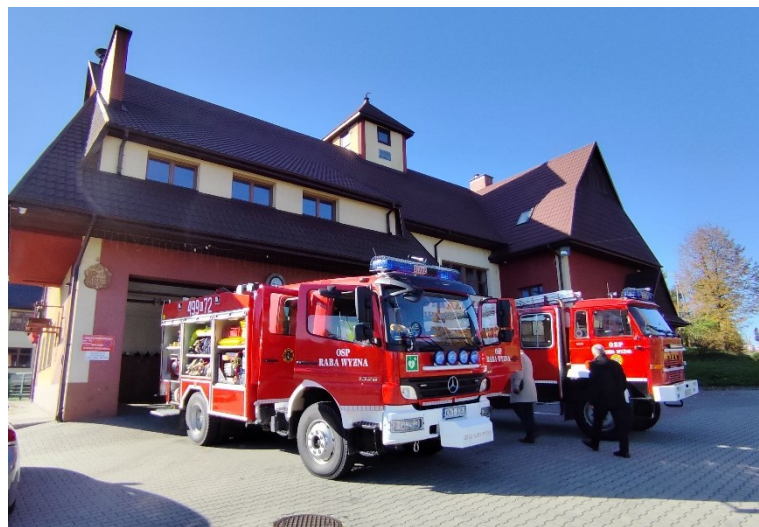
Návšteva predstaviteľov DHZ-O Gánovce a Spišské Hanušovce v Rabe Wyżnej.