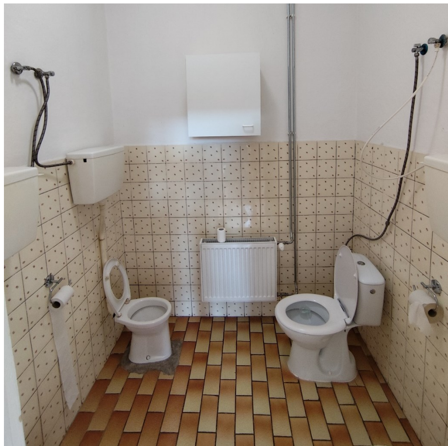
Pôvodný stav sociálnych zariadení v MŠ.

V letných mesiacoch prebehla veľká rekonštrukcia sociálneho zariadenia materskej školy. Došlo ku kompletnej výmene toaliet, umývadiel, podláh, zhotovené boli aj nové omietky či repasované dvere, výmena vchodových dverí, rozvody el. siete, zavedenie podlahového kúrenia.