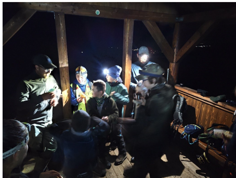
V rovnaký deň sme uskutočnili 3. ročník Svätomichalského nočného výstupu na Zámčisko