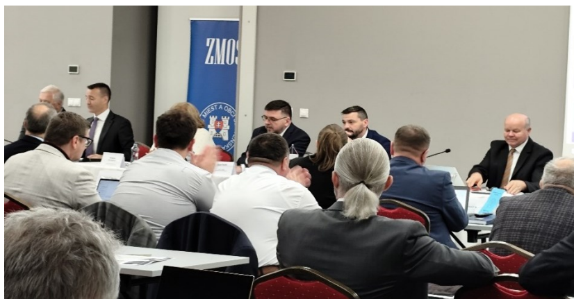
Rokovanie Rady ZMOS s ministrom školstva T. Drúckerom dňa 17. 04. 2024 vo Zvolene.

Zásadnou zmenou je prenos originálnej kompetencie financovania materského školstva pod štát, v rámci naplnenia míľnikov Plánu obnovy a odolnosti SR.