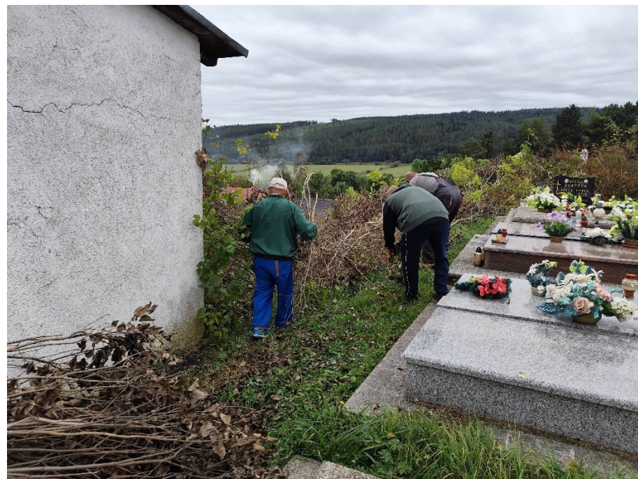
28. septembra sme zorganizovali obecnú brigádu na filickom cintoríne.

zdroj: kniha Gánovce v rokoch 1918 - 1945